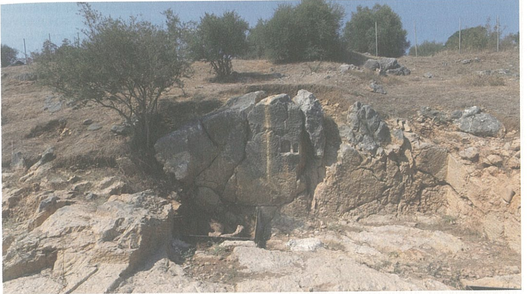
Resim 5 – Kaya Kutsal Alanı, kazılardan sonra

Nişlerden en büyüğü olan soldakinin çevresinde ayrıca, in size tekniğinde işlenmiş bir naiskos dikkat çeker. Sağda yer alan en küçük nişin tabanı diğerlerine göre 9 cm daha yukarıdadır. Aybek, üç nişin farklı zamanlarda taş yüzeyine işlendiğini düşünmektedir. Nişlerin üst bölümleri yarım daire şeklinde sonlanmaktadır. Her nişin derinliği genişliğinin yaklaşık yarısı kadardır. Alanda defincilerin tahribatının artması üzerine 2017 yılında kurtarma kazılarına başlanmıştır (Resim 5). Kazılar sonunda alanda iki evreli bir yapılaşma olduğu tespit edilmiştir. Pagan inancı döneminde nişlerden dolayı Kaya Kült Alanı olmalıdır. Hangi tanrının burada saygı gördüğüne dair herhangi bir ipucu henüz tespit edilememiştir. Ancak, kutsal alanın yola inen tıraşlanmış yüzeyinde yaptığımız sondaj kazısında, nişlerin bulunduğu terasın yaklaşık 3 m yüksekliğindeki bir podyum üzerinde yer aldığı anlaşılmıştır. Bu durum burada kent açısında önemli bir tanrının saygı gördüğüne işaret etmektedir. Hıristiyanlığın kabul edilmesi ile birlikte kaya kült alanı ışliklerin bulunduğu sektöre dönüşmüştür.