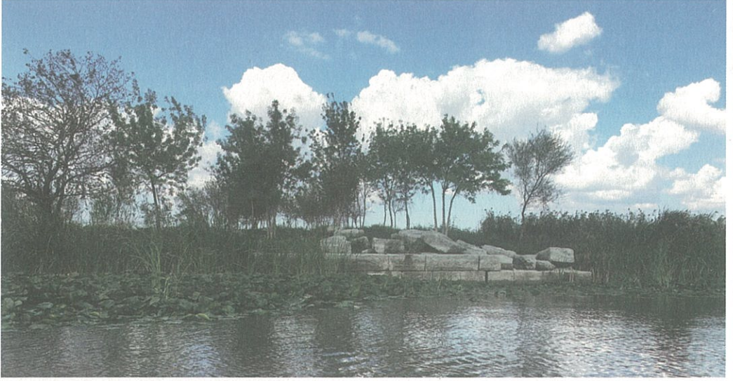
Resim 14 – Kız Ada Apollon Kutsal Alanı Temenos Duvarı

kültür Praxiteles tarafından MÖ 350 civarında yontulan Apollon Sauroktonos tipinde olmalıdır.