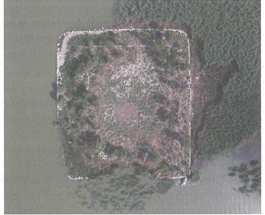
Resim 13 – Kız Ada Apollon Kutsal Alanı

100 x 88,85 m boyutlarındaki temenos duvarının tamamı görülebilir hale getirilmiştir (Resim 14). Adanın güney tarafından korunan blokların üzerinde yer alan kurşun akıtma kanalları nedeniyle temenos duvarının yaklaşık 2,5 m yükseklikte olduğu tahmin edilmektedir. Temenos duvarının doğusunda in situ bulunduğu anlaşılan sandal bağlama halkaları tekneler ile gelen ziyaretçiler için düşünülmüş olmalıdır. Ada üzerinde yer alan tapınak ve stoaya ait sütun tamburları ve kaidelerin bir bölümü temenos duvarı dışında olmak üzere göl içerisinde de bulunmaktadır. III. Gordianus Dönemi sikkeleri üzerinde yer alan betime göre, in antis tapınağın kült heykeli hey-