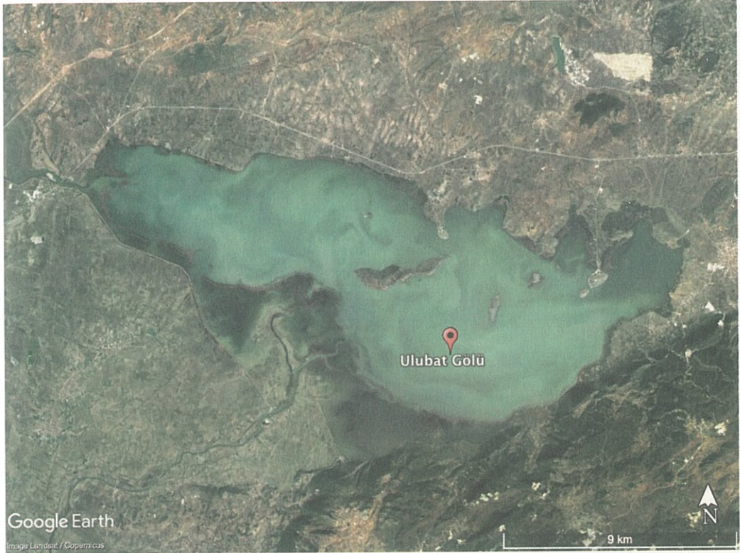
Resim 1 - Uluabat Gölü

sonra Aktopraklık B yerleşmesine taşınmış ve bundan sonra, Erken Kalkolitik Çağ'da Aktopraklık C mezarlık olarak kullanılmıştır. Höyük ilk olarak 2002 yılında sanayi sitesi yapılacak alanda yapılan hafriyat çalışmaları esnasında tesadüfen bulunmuş ve ilk kurtarma kazıları Bursa Müzeler Müdürlüğü tarafından yapılmıştır. 2004 yılından başlayan bilimsel arkeolojik kazılar günümüzde de devam etmektedir. İlk yerleşimin MÖ 6. binyılda başladığı tahmin edilen Höyükte, yaşam Bizans Çağına kadar devam etmiştir. Höyük alanı koruma altına alınarak açık hava müzesi şekline getirilmiştir.