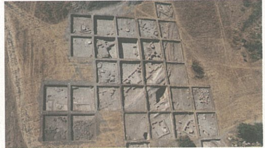
Resim 2 - Aktopraklık B alanı genel görünüm

Uluabat Gölü kültürleri içerisinde en önemli yerleşimlerden birisi Gölyazı Mahallesi'nde yer alan Apollonia ad Rhyndacum kentidir (Resim 3). 18. yüzyıldan başlayarak seyyah ve araştırmacıların ilgisini çeken kentte ilk ciddi araştırmalar Serdar Aybek tarafından yapılmıştır. Bu çalışmalarda kentin nekropol alanı, kaya kült alanı, tiyatrosu ve stadiumu tespit edilerek kayıt altına alınmıştır. Bilimsel arkeolojik kazılar ise 2016 yılında Bursa Müzeler Müdürlüğü'nün başkanlığında ve Bursa Uludağ Üniversitesi Arkeoloji Bölümü'nün bilimsel danışmanlığında