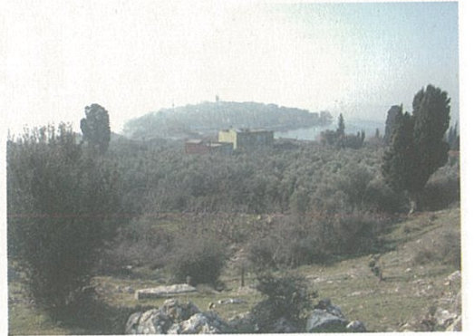
Resim 6 – Tiyatronun bulunduğu Zambak Tepe

alan Antik Tiyatro 'da S. Aybek tarafından 2006 yılında özdirenç tomografi ile tespit çalışmaları yapılmıştır. Bu incelemeye göre, tiyatronun parodos girişleri, alt cavea sıraları, orkestra zemini ve sahne binasının iyi durumda korunmuş olduğu tahmin edilmektedir. Çapının 75 m olduğu düşünülen tiyatronun 4000 kişi kapasiteli olduğu varsayılmaktadır (Resim 6). Tiyatronun oturma sıralarının büyük bir bölümü kent surlarında devşirme olarak kullanılmıştır (Resim 7).