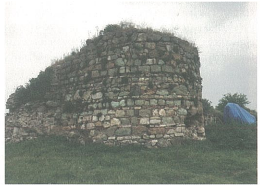
Resim 11 – Lopodion kentinin sur duvarına ait günümüze ulaşan kulelerden birisi

Lopodion, bir yandan Apollonia'yı Marmara Denizi'ne bağlayan su yolu, diğer yandan da İstanbul'u güneye bağlayan kara yolu üzerinde yer alması nedeniyle oldukça stratejik bir noktadadır. Lopodion'un, Bursa çevresini Sarazenlere karşı savunmak için Doğu Roma İmparatoru ve Komnenos Hanedanı'nın kurucusu Aleksios Komnenos (1081 - 1118) tarafından kurulduğu bilinmektedir. Kent, Kocasu çayını geçen tek taş köprüden gelen kara yolunun doğrudan kentin içinden geçmesini sağlayacak şekilde konum-