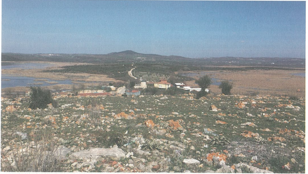
Resim 4 – Zambak Tepe'den Nekropol Alanı

Zambak Tepe'nin doğu yamacında yer alan Kutsal Alan da S. Aybek tarafından tespit edilen yerler arasındadır. Alınlık şeklinde düzleştirilen anakayanın yüzeyinde 3 adet niş bulunmaktadır.