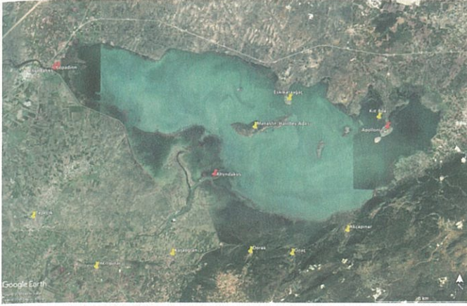
Resim 15- Uluabat Gölü Havzası Yerleşimleri

aynı zamanda Marmara Denizi'ne açılan nehir ticaret yolunun da en önemli bağlantısıdır. Göl çevresinde tespit edilen kültür varlıkları arasında çoğunluğu, özellikle gölün güney kısmındaki tepelerde yoğunlaşan, mezarlar oluşturmaktadır. Bunlar dağınık bir görüntü arz etmekte birlikte,