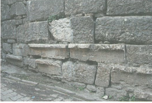
Resim 7 – Tiyatro veya Satadion'dan getirilerek sur duvarında devşirme olarak kullanılan oturma sıralarına örnek

Zambak Tepe'nin kuzey yamacında yer alan Stadion , Lé Bas – Reinach'ın kent planında da görülmektedir. Yapıya ait kireçtaşı oturma bloklarının yerleştirildiği ana kaya üzerindeki temel yataklarının bir bölümü hala görülebilmektedir. Oturma sıralarına ait blokların bir bölümü ise kentin sur duvarlarında devşirme olarak kullanılmıştır (Resim 7). Stadion'un bulunduğu alan