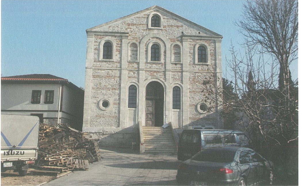
Resim 8 - Aziz Panteleimon Kilisesi

Uluabat Gölü'nün güneyinde yer alan Akçapınar , Mustafakemalpaşa'nın sınır mahallelerinden birisidir. Modern köy eski yerleşim ile