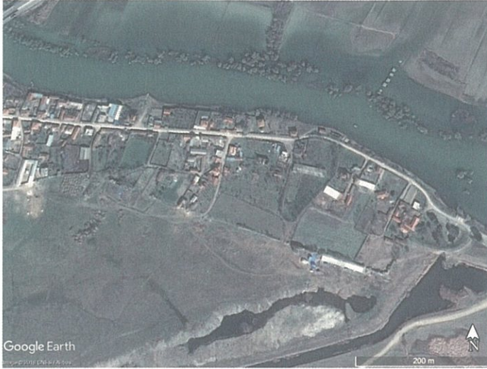
Resim 10 – Lopodion kenti ve kente geçişi sağlayan taş köprüye ait kalıntılar