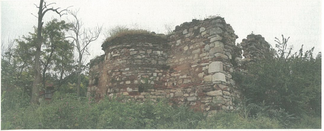
Resim 12 – Kilise kalıntısı

landırılmıştır. Böylece karadan ve su üzerinden geçen taşıtların denetimini sağlayan bir karakol kent görünümünü almıştır. Lopodion ile aynı tarihlerde inşa edildiğini düşündüğümüz taş köprüye ait kalıntıların bir bölümü günümüzde hala in situ olarak ayakta. Ch. Texier, Lopadion'un inşasında kullanılan mimari malzemenin Miletoupolis kentinin yıkıntılarında taşındığını rivayet etmektedir.